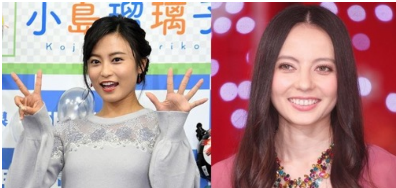
《左：小島瑠璃子さん、右：ベッキー》