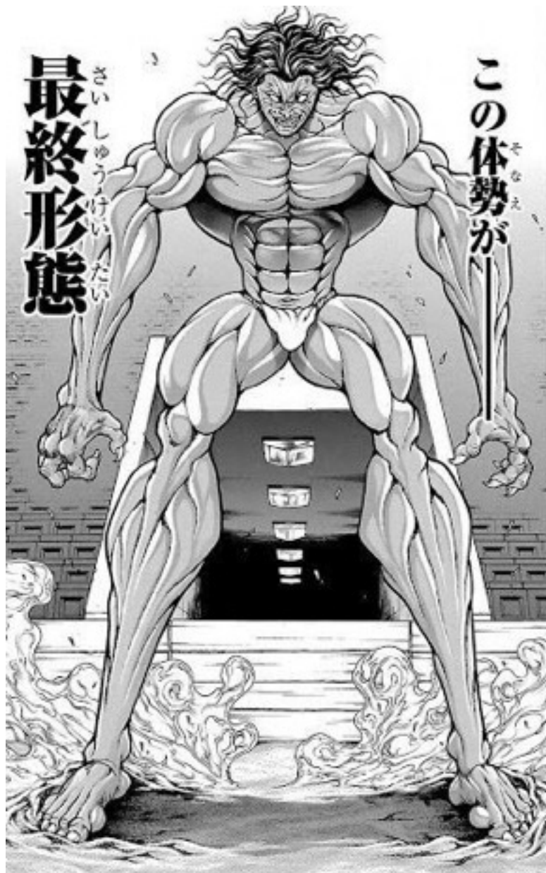
《刃牙の登場キャラクター ピクル》